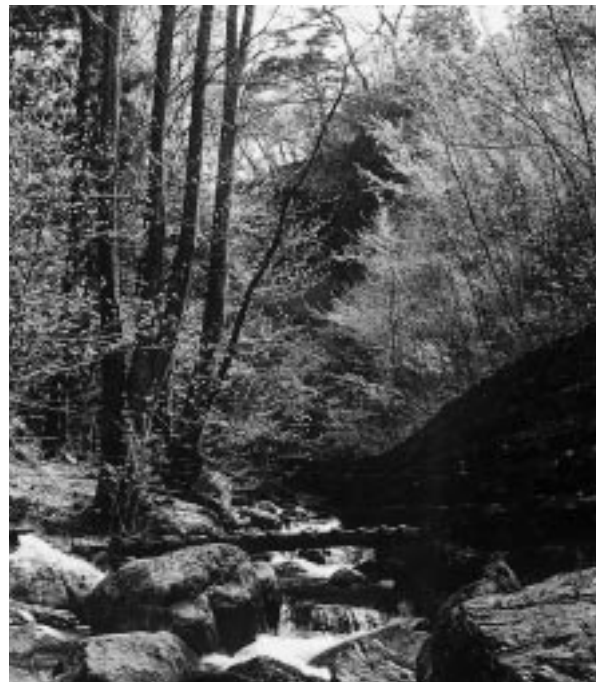
きれいな水のために森林づくりを

今年三月に完成した「し尿処理施設」は、当初は建設費の総額が約八十二億円、このうち桐生市他広域圏での負担分が約五十三億でしたが、事業の見直しと、国の補助金等を導入し、総額が約五十二億円、桐生市等の負担分を約十六億円にまで削減することができました。こうして浮かせた経費は市民のために別の事業に使う事ができます。また、五年後の平成十九年度には、北関東自動車道の全線開通が予定されています。交通網の整備による市の活性化のため、北関東自動車道へのアクセス道路の建設を進めて来ましたが、道路整備は莫大な経費が必要で、平成十年度の段階では北関東自動車道の開通に間に合いそうもない状況でした。しかし平成十