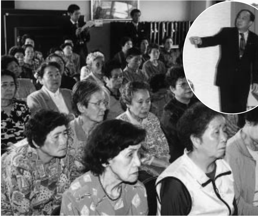
熱心に講話に聞き入る東公民館高齢者学級の皆さん

昨年度、市内各小学校で、「耳をすませば森林のささやきが聞こえる」をテーマに、市長の出前講座を開催。多くの小学生から共感と、家族で取り組んだ環境保全の報告の手紙など、大変な反響をいただきました。今年度はより多くの人に気軽に、市政の現状と課題について知っていただけるよう、生き生き市役所出前講座のメニューに、「市長講話」を加えました。今号では桐生市の財政状況、競艇事業、森林づくり等、「市長講話」の概要を紹介します。